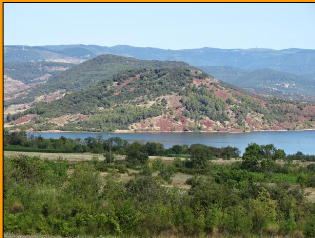
Naturerlebnis Lac du Salagou.