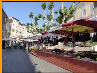
Markt von Clermont l`Hérault.