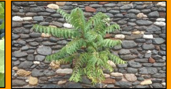
Die Seele baumeln lassen.