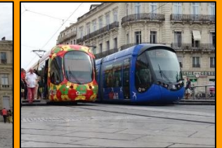
Tagesausflüge nach Montpellier oder Carcassonne.