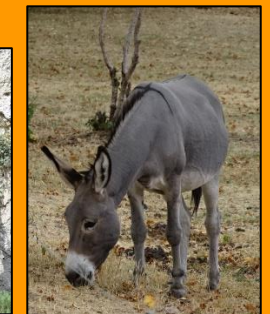
Verwunschene Orte und Stellen wollen entdeckt werden.