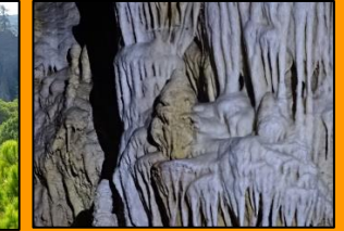
Ausflugsziele um die Ecke.