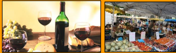
Wein und südfranzösische Spezialitäten für den Gaumen.