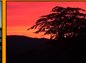
Abendstimmung am Lac du Salagou.