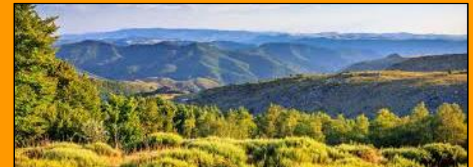
...und der Naturraum Cevennen zum Erleben.