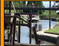
Das Mittelmeer und der Canal du Midi in greifbarer Nähe.